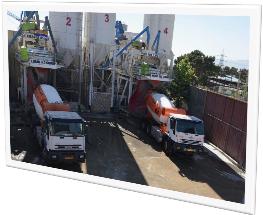
کارخانه بتن دنا بتن آبادنا

تهران ، بلوار آزادگان شرق ، خیابان تالار گل سرخ