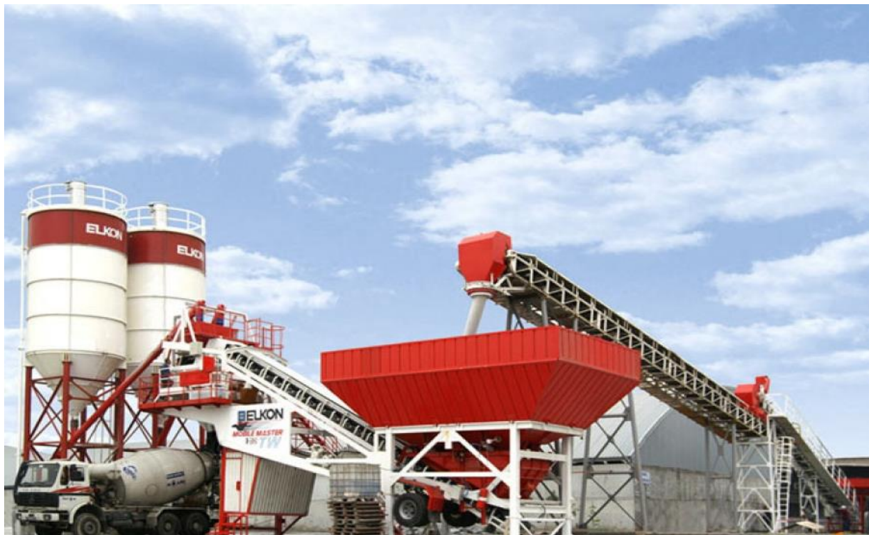
کارخانه بتن آماده بیلکون (پیمانکار ایتالیایی در هرمزگان)